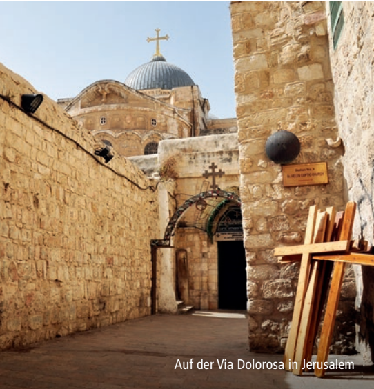
Auf der Via Dolorosa in Jerusalem

Zeichen der Passion Jesu Christi steht der Nachmittag. Wir pilgern entlang der Via Dolorosa . Zunächst erwartet uns die Kreuzfahrerkerche St. Anna am Teich von Betesda. Wir gehen am Ecce-Homo-Bogen vorbei und betreten die Burg Antonia. Hier erinnern uns das historische Steinpflaster und die Geißelungskapelle an das Leiden Jesu. Die Grabeskirche , der heiligste Ort der Christenheit, bildet den Abschluss des heutigen Tages.